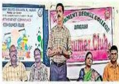
నగరి: వస్తువుల కొనుగోలులో జాగ్రత్తలు పాటించాలి