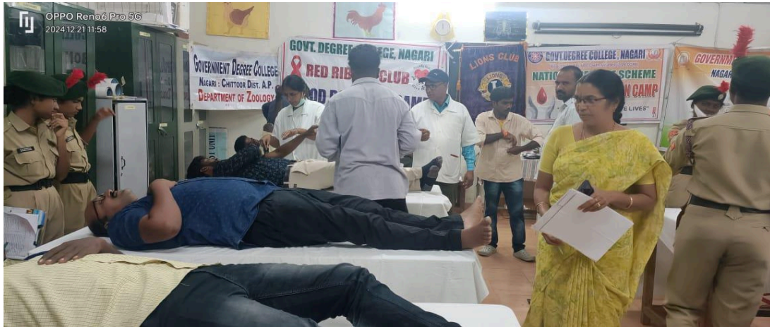
Blood donation camp