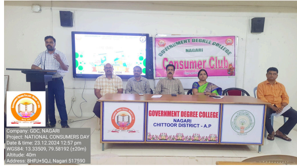
Company: GDC, NAGARI Project: NATIONAL CONSUMERS DAY Date & time: 23/12/2024 12:57 pm WGS84: 13.33509, 79.58192 (+20m) Altitude: 40m Address: 8FHJ+5QJ, Nagari 517590